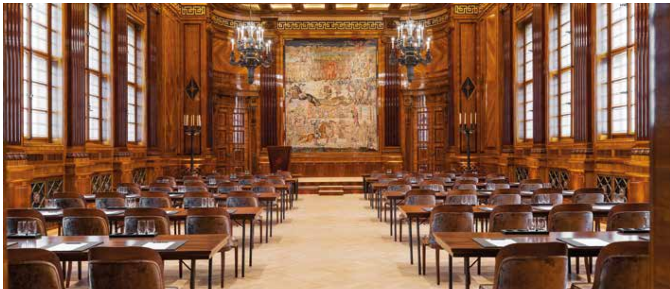
Park Hyatt Vienna