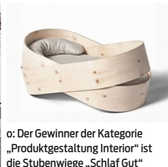
o: Der Gewinner der Kategorie „Produktgestaltung Interior“ ist die Stubenwiege „Schlaf Gut“