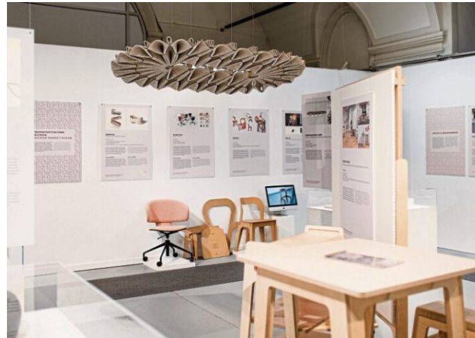
Bis zum 3. Juli 2024 läuft die Ausstellung „Best of Austrian Design“ im designforum Wien mit den Gewinnern des Staatspreis Design 2024